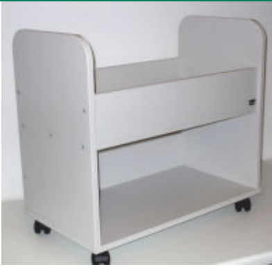
Art.-Nr. 7510 vergrößern