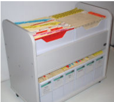
Art.-Nr. 7510S vergrößern

*Preis zzgl. € 3,95 Versandkosten + USt (nur bis zum 31.12.2005)